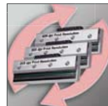
La resolución máxima de impresión puede incrementarse utilizando cabezales opcionales intercambiables