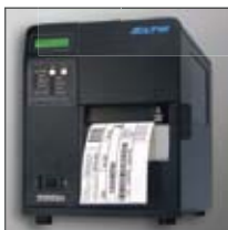
Diseñada para uso potente industrial